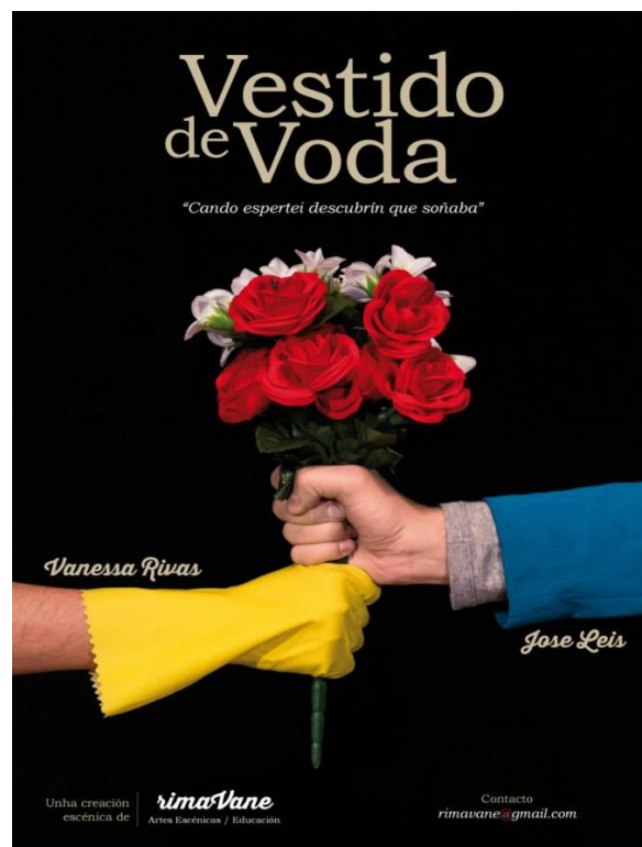
FIGURA 3: Cartel de la actividad. Elaboración propia.

AtalaiA Social lleva años desarrollando actividades a través de la caracterización de personajes y representaciones teatrales, lo que permite visibilizar de forma gráfica las figuras y personas que se transforman en agentes educadores. Creemos que la utilización de una metodología activa y participativa permite captar la atención de las personas e incorporar un aspecto clave para la interiorización de los contenidos: la conexión emocional y la vivencialidad.