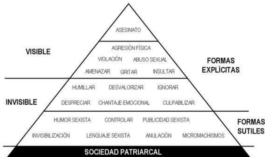
FIGURA 2: Pirámide de la violencia de género. Elaboración propia

Tras escuchar las aportaciones del público y generar debate las educadoras introducen de forma gráfica a través de una pizarra la metáfora de la violencia de género como una pirámide tal y como se muestra en la figura número 2: