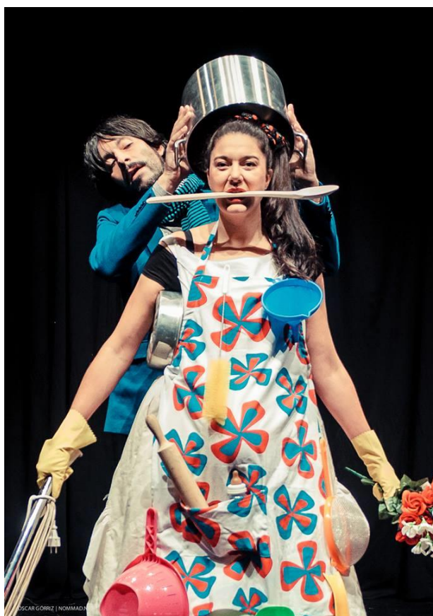
FIGURA 4: Foto del final de la obra. Elaboración propia.

Esta es otra de las diferencias con el teatro del oprimido, pues aquí se considera importante dar visibilidad a otro tipo de relaciones afectivas de pareja y romper con los estereotipos de género que crean roles e ideas de amor romántico que continúan muy arraigadas en la actualidad. Finalizar con una pieza diferente aporta estrategias para promover el cambio.