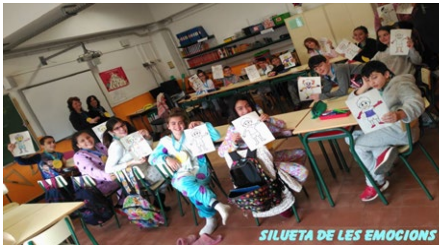
Proyecto 6ESO Escuela Barkeno