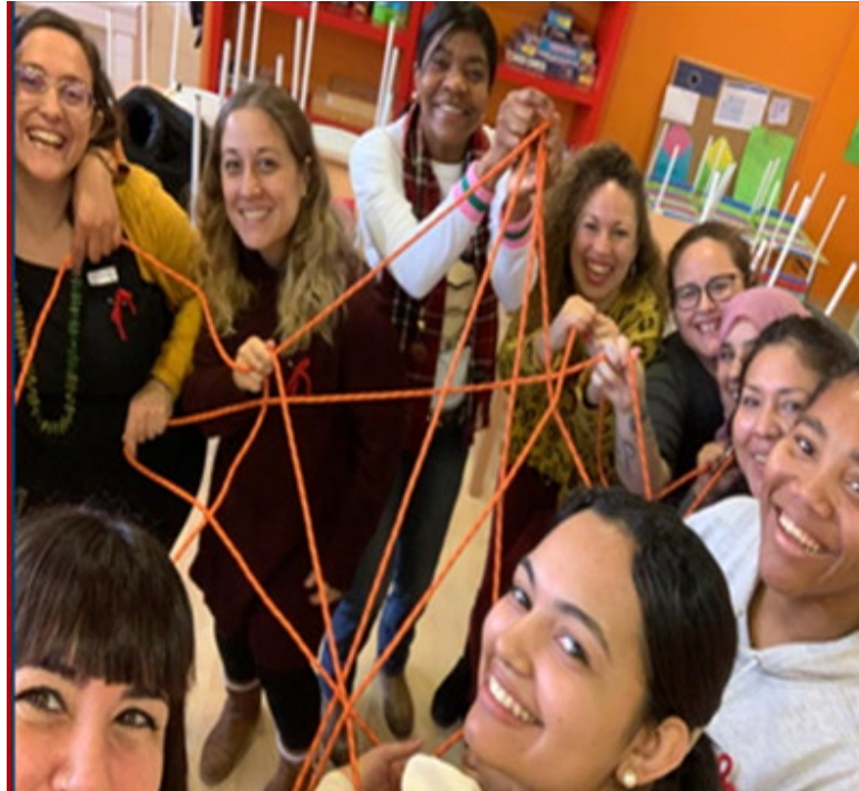
Lazos- taller familias EB Aqüeducte