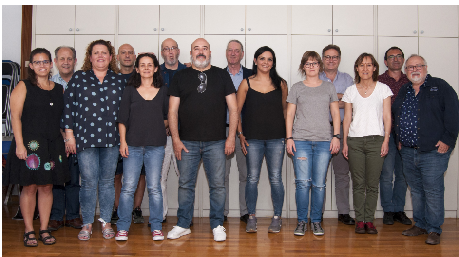
Comité Científico reunido en Zaragoza (septiembre 2018)

Para la elección del Comité se tuvo en cuenta el criterio de paridad de género, la representación territorial y la experiencia en la organización de Congresos anteriores quedando constituido por: