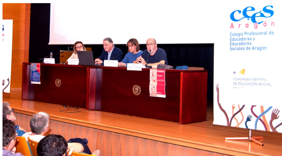
Presentación del VIII Congreso en Zaragoza durante los actos del Día Internacional de la Educación Social 2019

A través de la de la vocalía de comunicación el CGCEES, los referentes de cada territorio comunicarán toda la información congresual a las Juntas de los Colegios y por ende, a todas y todos los colegiados.