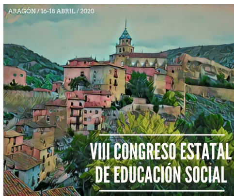
Imagen para compartir en Twitter