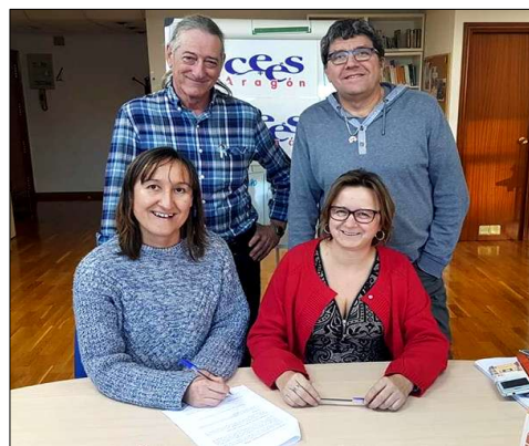
Comisión mixta CGCEES – CEES-Aragón

Para la organización del Congreso, además de la Comisión Mixta creada entre el CGCEES y el CEES-Aragón, se han configurado dos Comités: