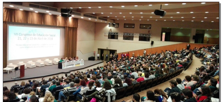
Imágenes de los Congresos de Valencia 2012 y Sevilla 2016