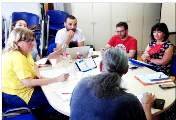
Reunión del Comité Organizador

Educación Social). Estamos trabajando para que este evento tenga una presencia significativa y relevante en los medios de comunicación y en las agendas de los diferentes grupos de interés (universidad, instituciones públicas, empresas, etc.), con la finalidad de ser un impulso más hacia la implantación de estudios presenciales de Educación Social en Aragón.