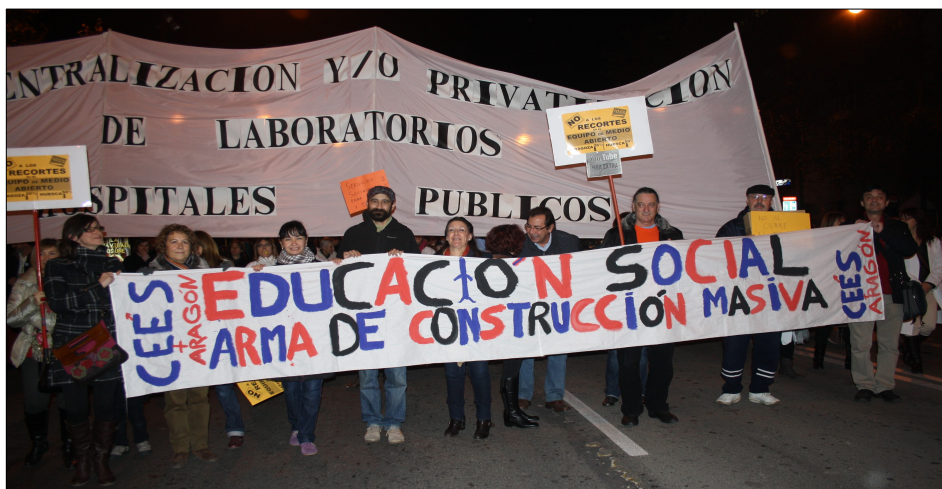
Educadores Sociales de Aragón en las manifestaciones contra los recortes

Todas y todos, personas que reciben nuestra acción y profesionales de la Educación Social, vivimos inmersos en una realidad sociopolítica que condiciona nuestro acceso al ejercicio directo de derechos. Y todas y todos hemos de estar comprometidos socialmente desde nuestra participación en la configuración de la sociedad.