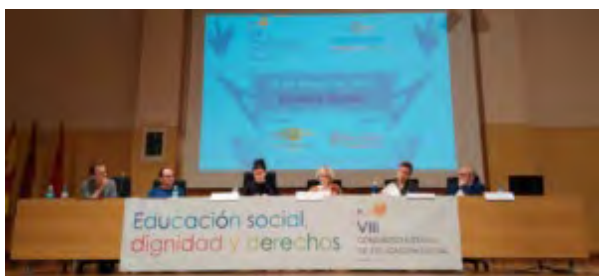
Mesa Las paradojas de la Educación Social y sus efectos