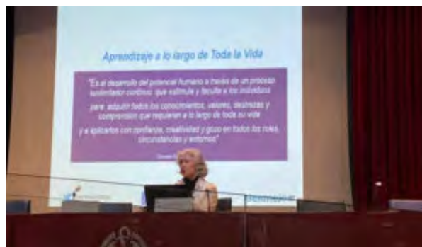
Conferencia “Educación Social: una herramienta transformadora de valores de ciudadanía para el ejercicio de derechos y responsabilidades”