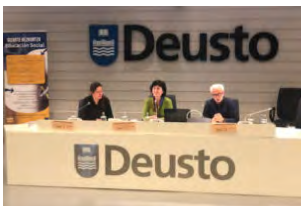
Diálogo abierto: La Educación Social como elemento clave de las políticas sociales