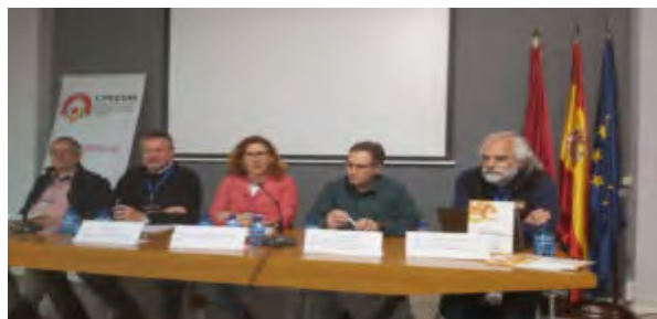
Taller participativo / coloquio: Ética transversal a la Educación Social. El compromiso de los/las profesionales