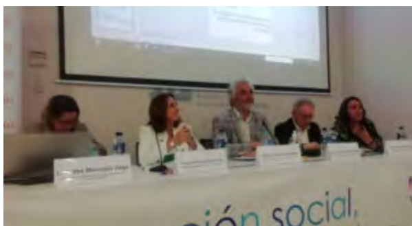
Mesa Educación Social y Universidad: recorridos y retos para la profesionalización