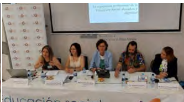
Mesa coloquio. La regulación profesional de la Educación Social: derechos y dignidad