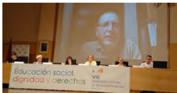
Mesa Ejes estratégicos y educación social en la Ley de Servicios Sociales