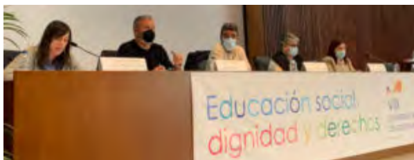
Mesa coloquio "La dignidad de las/los éxito de la Educación Social en el Sistema Tercer Sector"