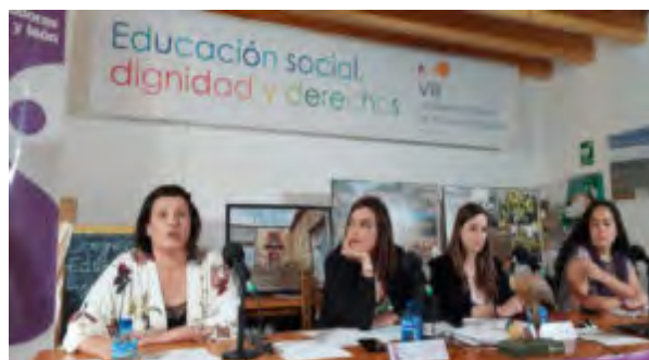
Panel de experiencias esperanzadoras en el medio rural