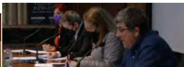
Mesa coloquio: La dignidad de las/los profesionales de la Educación Social, desde el sector Público