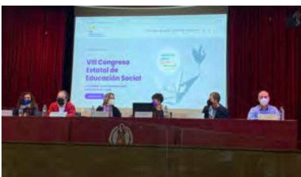
Mesa de inicio

RES, Revista de Educación Social , es una publicación digital editada por el Consejo General de Colegios Oficiales de Educadoras y Educadores Sociales (CGCEES). La Revista RES forma parte del proyecto EDUSO y se integra en el Portal de la Educación Social, http://www.eduso.net/res . Correo electrónico: res@eduso.net . ISSN: 1698-9007.