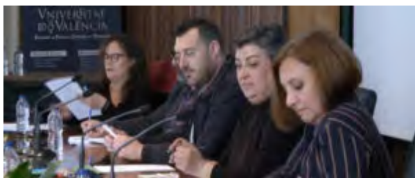
La Educación Social en la gestión de equipos y centros