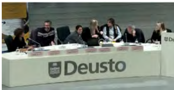
Mesa Coloquio: Los retos de la Educación Social en Ejecución Penal, el sistema penitenciario y la inclusión social Comunicaciones al congreso publicadas en la revista RES número 33