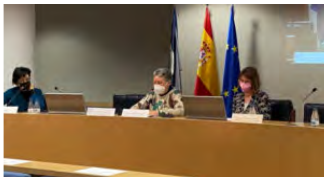
Mesa La responsabilidad de la acción institucional