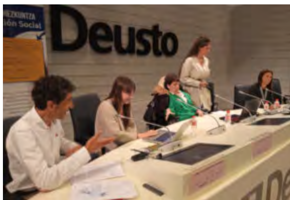
Espacios de Diálogo: Intervención socioeducativa en Servicios Sociales de Atención Primaria: próxima, personalizada, relacional y el ámbito de la diversidad funcional: derechos y dignidad de las personas