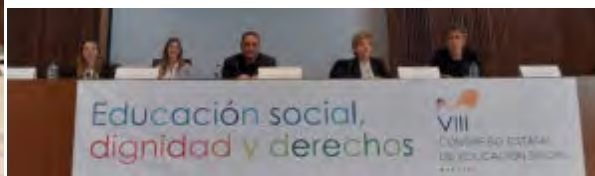
Presentación de experiencias socioeducativas de