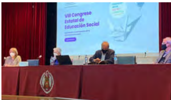
Mesa “La Educación Social frente al edadismo y la soledad no deseada”