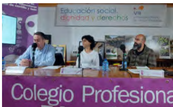
Espacio de Diálogo: Entre un Educador Social y una Educadora Social