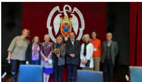
Intervinientes en la segunda sesión en Madrid

Se realizó también un Encuentro de Profesionales de Envejecimiento Activo y Aprendizaje a lo Largo de la Vida del CGCEES.