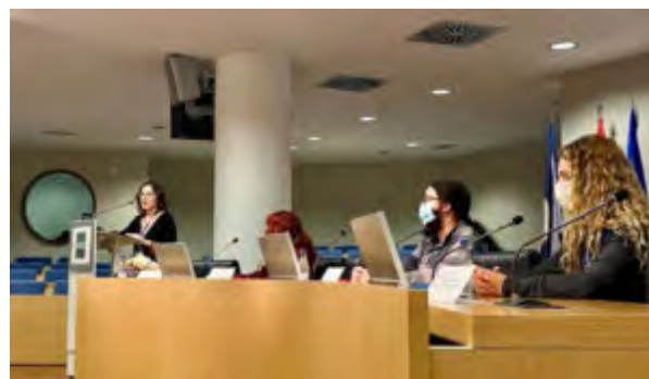
Mesa El compromiso de la acción socioeducativa con la infancia: experiencias y retos