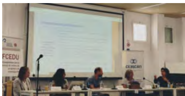
Mesa Coloquio Las y los profesionales de la Educación Social en el sistema educativo.