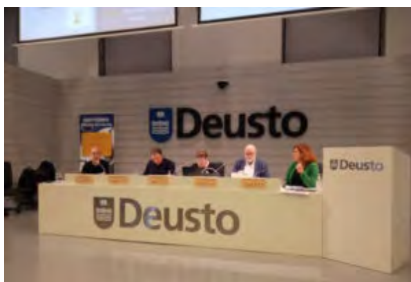
Mesa Coloquio: El compromiso de la Educación Social con la Acción de las Políticas Sociales. Justicia Social