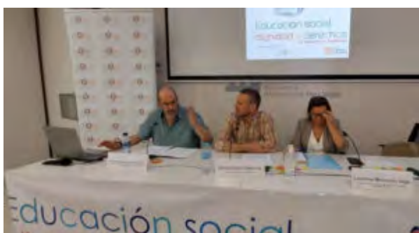
Conclusiones y Clausura