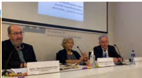
Ponencia dialogada. La Acción Socioeducativa como acción transformadora, derechos y justicia social