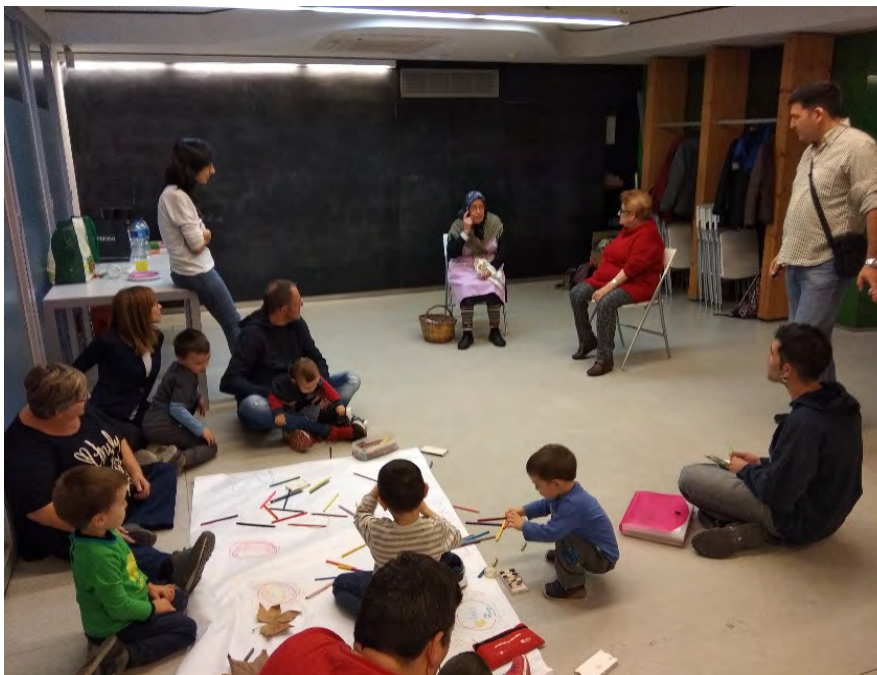
Ilustración 2: actividad "Familias, Juguem?", visita de la Castañera. (2019).

En él, participan 9 mujeres y durante el siguiente curso se ejecutarán hasta un total de 5 acciones con distintos colectivos.