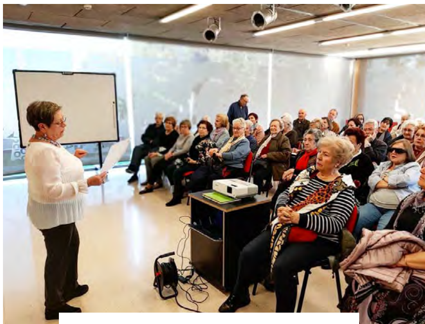
• Ilustración 3: Cinefòrum. (2019).