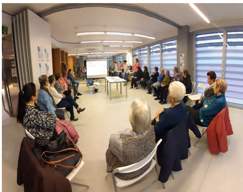
Ilustración 5: Fes-te Gran a Verdum. (2019) . Fuente propia

La experiencia se ha vivido con satisfacción mutua, pues a los profesionales les facilita conocer las preocupaciones y sentires del colectivo más allá de aquellos elementos identificados en su trabajo diario, a la vez que las vecinas refuerzan la confianza con su referente profesional y lo pueden interpelar con mayor horizontalidad .