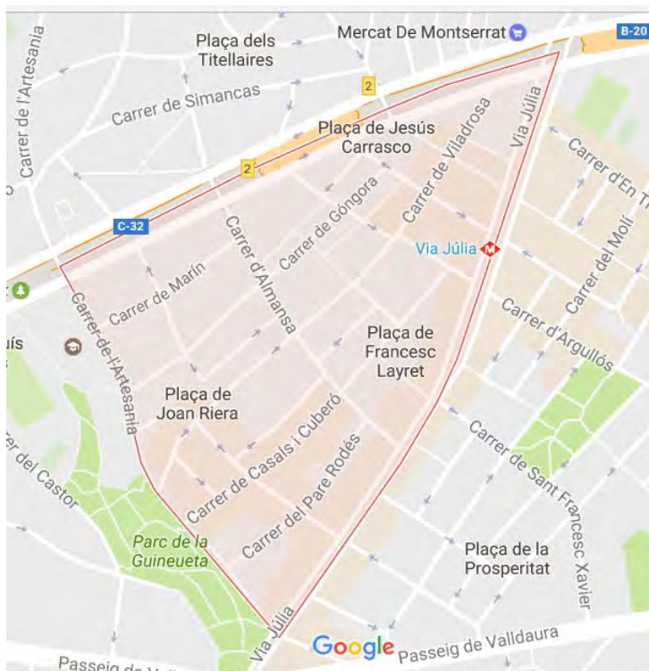
Ilustración 1: mapa Barrio de Verdum. (s.f).

El Plan Comunitario de Verdum (de ahora en adelante PCV) 1 se sitúa en el barrio de Verdum, 2 distrito de Nou Barris, ubicado en la zona nordeste de Barcelona. Limita con los barrios de Prosperidad, Roquetes y Guineueta.