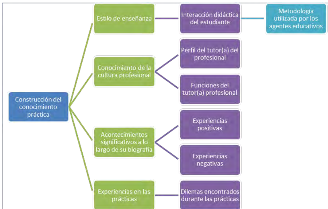
Imagen 2. Esquema del análisis cualitativo en la aplicación de los instrumentos con respecto a la construcción del conocimiento práctico del estudiante. (Elaboración propia).

A continuación, mostramos algunas de las citas recogidas al respecto que nos pueden facilitar la comprensión del análisis realizado, puntualizando en las categorías y sus subcategorías a las que hacen referencia: