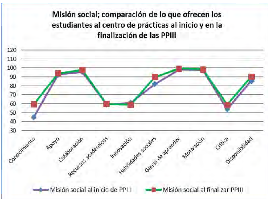
Gráfico 2. Comparación de la misión social de la profesión, con respecto a las valoraciones que los estudiantes hacen sobre sus aportaciones al centro de prácticas al inicio y al finalizar las PPIII. (Elaboración propia).

En la dimensión de los valores adquiridos que orientan la práctica profesional, se tuvieron en cuenta los principios deontológicos establecidos en la profesión de Educación Social, que han sido definidos de acuerdo con los documentos profesionalizadores determinados por la Asociación Estatal de Educación Social (ASEDES, 2007). La mejora conseguida por los estudiantes al finalizar las prácticas viene establecida en el gráfico 3. De manera general pudimos encontrar mejoras con respecto al inicio de las prácticas de un 15%.