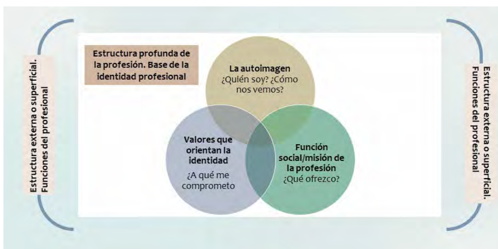
Imagen 1. Estructura de la identidad profesional. Elaboración a partir de las premisas de Vilar (2011) y recogido de Martín-Cuadrado, García-Vargas, González. (2018).

Los datos presentados son los más relevantes, y han sido recopilados en relación al análisis desarrollado tanto desde enfoques cuantitativos como análisis cualitativos utilizando software específicos al respecto (SPSS versión 21 y ATLAS.ti versión 8.2), así como datos obtenidos de los cuestionarios diseñados en Google Forms.