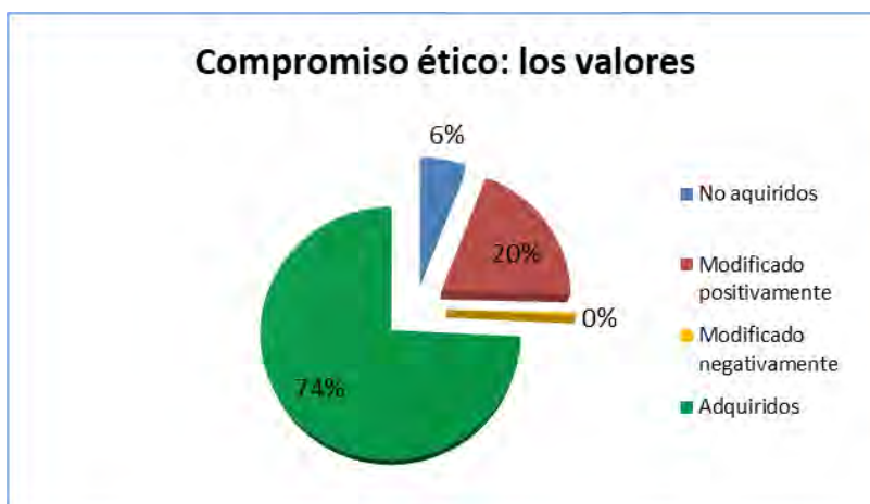
Gráfico 3. Valores basados en los Principios Deontológicos. (Elaboración propia)

En la dimensión de los valores adquiridos que orientan la práctica profesional, se tuvieron en cuenta los principios deontológicos establecidos en la profesión de Educación Social, que han sido definidos de acuerdo con los documentos profesionalizadores determinados por la Asociación Estatal de Educación Social (ASEDES, 2007). La mejora conseguida por los estudiantes al finalizar las prácticas viene establecida en el gráfico 3. De manera general pudimos encontrar mejoras con respecto al inicio de las prácticas de un 15%.