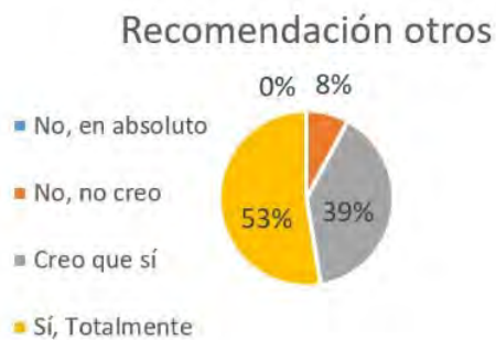
Figura 4. Recomendación a otros