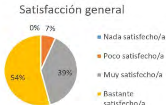
Figura 2: Satisfacción general