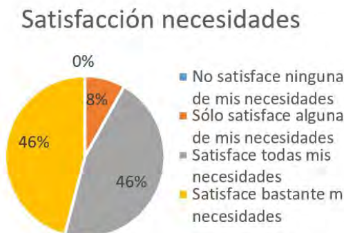
Figura 3: Satisfacción de necesidades