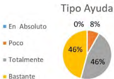
Figura 5. Tipo de ayuda recibida