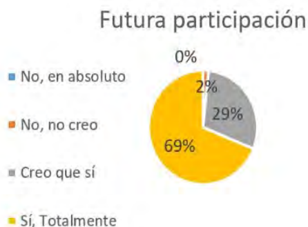
Figura 8. Futura participación