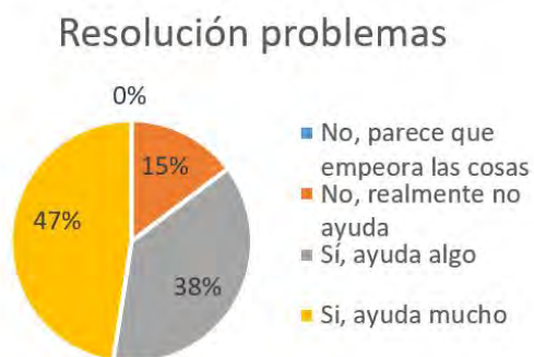
Figura 7. Resolución de problemas