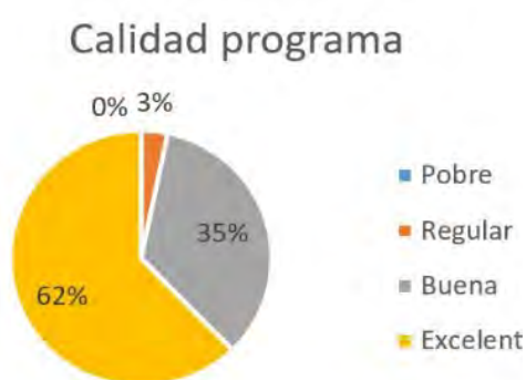
Figura 1: Calidad del programa

Para conocer los resultados del programa en el formato online en cuanto al cambio percibido por las familias, se realizó la evaluación manteniendo el diseño implementado en la etapa de pilotaje y cuyos resultados aparecen detallados en el informe de Evaluación del Programa de Apoyo Integral a las Familias (PAIF). El proceso de evaluación consistió tanto en la recogida de información cualitativa a través de un grupo de discusión con las familias como en la utilización de instrumentos de evaluación cuantitativa estandarizados. La respuesta que se obtuvo por parte de las familias en cuanto a satisfacción con el programa fue muy elevada, coincidiendo el grupo de discusión con los datos obtenidos a través del CSQ (Cuestionario de satisfacción) como se muestra en las siguientes gráficas: