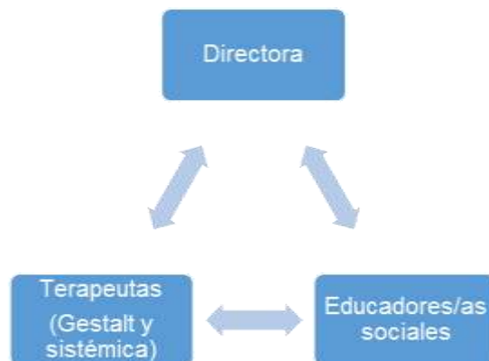
Gráfico 1. Equipo multidisciplinar del Programa Intensivo para Jóvenes

Este programa pertenece al área de Educación Social del Instituto de Servicios Sociales (IFS) y tiene una directora de programa como máxima responsable y coordinadora de los seis proyectos anuales. En el programa trabajan además dos terapeutas que intervienen cada uno de ellos con una familia de los menores participantes en cada una de las fases del programa, pero sobre todo durante la fase de estancia en el extranjero del menor. Atendiendo a los principios de la terapia sistémica, los terapeutas intentan modificar las relaciones familiares para evitar que la conducta desadaptativa del/la menor continúe. Finalmente el equipo se completa con un/a educador/a social para cada uno de los seis proyectos que se realizan anualmente.