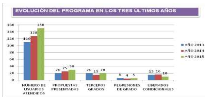
GRÁFICO 1. Evolución del programa en los tres últimos años

* PSR: Programa Semirresidencial. CT: Comunidad Terapéutica.