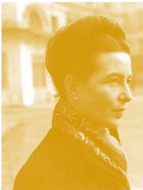
Simone de Beauvoir

Los movimientos feministas favorecieron que se hablase de esta desigualdad y que se fuesen tomando medidas al respecto. Una de ellas, y la que nos ocupa, es el de la formación, de impregnar de perspectiva de género todos los ámbitos de la vida, y para eso es necesario estar formadas y formados.