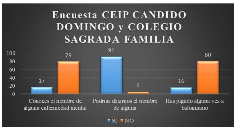
GRAFICO 3: conocimiento sobre la enfermedad mental 2018

MUESTRA: 96 ALUMNOS DE 5º DE PRIMARIA DEL CEIP CÁNDIDO DOMINGO Y COLEGIO SAGRADA FAMILIA. ZARAGOZA (2018). Elaboración propia.