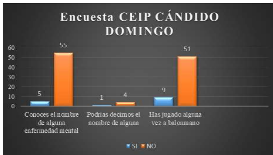
GRÁFICO 1: conocimiento sobre la enfermedad mental 2017

MUESTRA: 60 ALUMNOS DE 5º Y 6º DE PRIMARIA DEL CEIP CÁNDIDO DOMINGO. ZARAGOZA (2017). Elaboración propia.