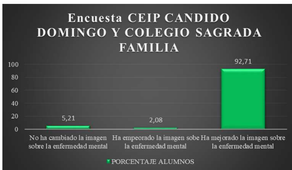
GRAFICO 5: cambio de la imagen que tenían sobre las personas con enfermedad mental (2018)

MUESTRA: 96 ALUMNOS DE 5º DE PRIMARIA DEL CEIP CANDIDO DOMINGO Y COLEGIO SAGRADA FAMILIA. ZARAGOZA (2018). Elaboración propia.