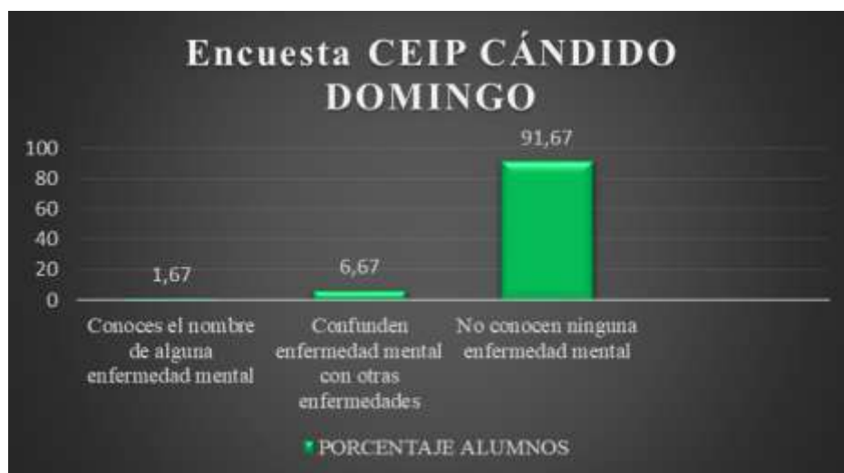
GRAFICO 2: conocimiento sobre la enfermedad mental 2017 (2)

MUESTRA: 60 ALUMNOS DE 5 Y 6 DE PRIMARIA DEL CEIP CÁNDIDO DOMINGO. ZARAGOZA (2017). Elaboración propia.