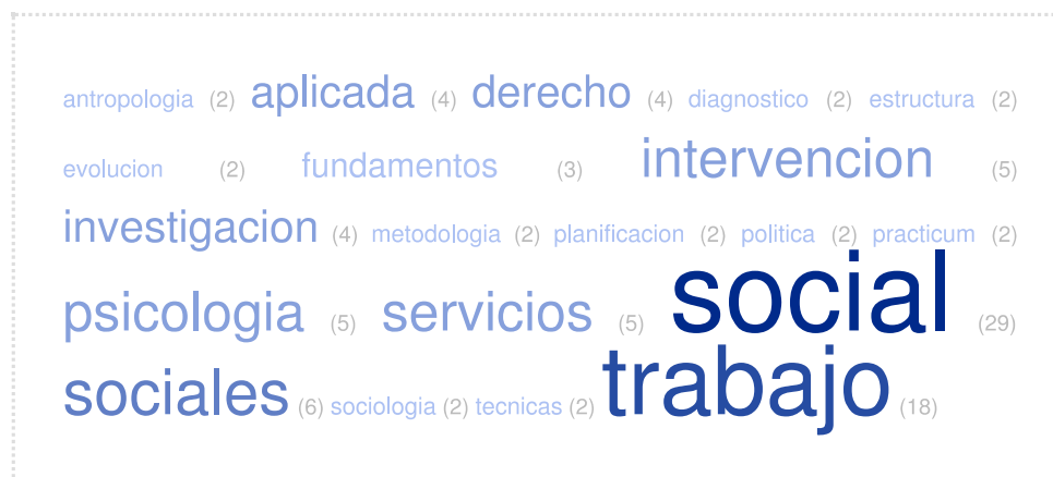
Ilustración 2: Palabras clave Planes Estudio Trabajo Social (Elaboración propia)

investigación, derecho e intervención. En el tercer bloque tenemos: política, planificación y técnicas. [Ilustración 2].