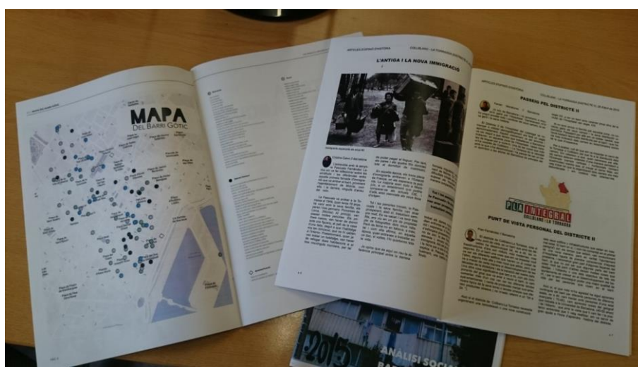
Foto 3 Mapa ilustrativo de los recursos del barrio

RES, Revista de Educación Social , es una publicación digital editada por el Consejo General de Colegios Oficiales de Educadoras y Educadores Sociales (CGCEES). La Revista RES forma parte del proyecto EDUSO y se integra en el Portal de la Educación Social, http://www.eduso.net/res . Correo electrónico: res@eduso.net . ISSN: 1698-9097.