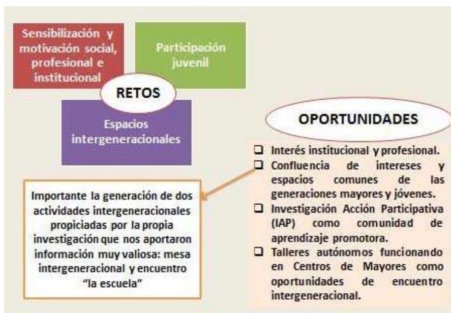
Imagen 5 –Retos y Oportunidades (Elaboración propia)