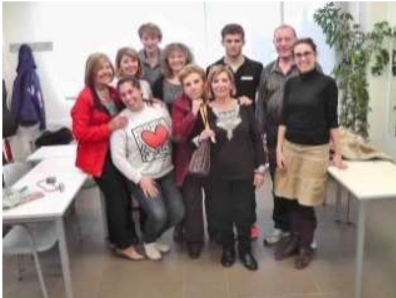
Imagen 7 – Mesa redonda intergeneracional

Triangulando, vemos oportunidades en las coincidencias de intereses de los dos colectivos, asociadas a imágenes positivas que tienen los jóvenes de los mayores, así como oportunidades de aprendizaje en ambas direcciones en torno a ellos.