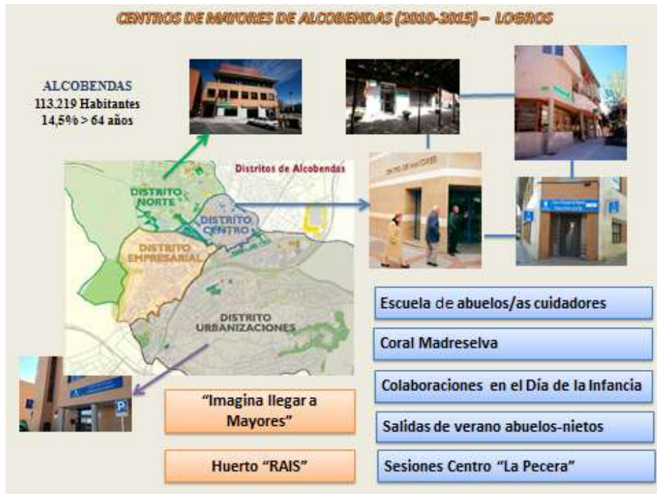
Imagen 2 – Logros (Elaboración propia)

Localizamos una Guía Práctica editada por la Diputación Foral de Bizkaia en 2015, titulada “Hacia una Sociedad Intergeneracional. ¿Cómo impulsar programas para todas las edades”, de donde extrajimos los programas de interés para el caso, tanto en el ámbito nacional como en el internacional, que relacionan a personas mayores y jóvenes? Los más significativos se muestran a continuación, tablas 2 y 3: