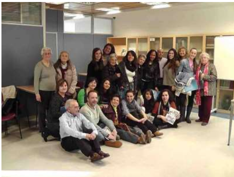
Imagen 6 – Grupo intergeneracional actividad “La escuela” – 20 de abril de 2016 Centro de Mayores “Pedro González Guerra”

✚ “La escuela” 2 : Se pudo constatar que abrir actividades de las personas mayores a los jóvenes es una forma de acercamiento entre las generaciones muy valiosa, en cuanto a intercambio de saberes y experiencias en ambas direcciones. Y hacerlo a través de un tema, en este caso la escuela , invita a la conversación, al debate y al descubrimiento mutuo.