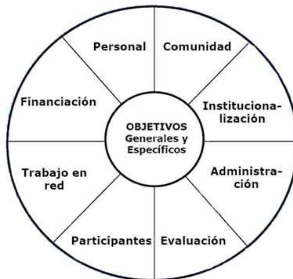
Imagen 9. Componentes en la Gestión de un programa intergeneracional (Fuente: Sally Newman, 1998).

Personal: Se necesita implicar a profesionales de muy distinto tipo (profesorado de instituto o colegio, profesionales de centros de mayores y centros juveniles, profesionales en participación ciudadana, etc.), con distintas necesidades.