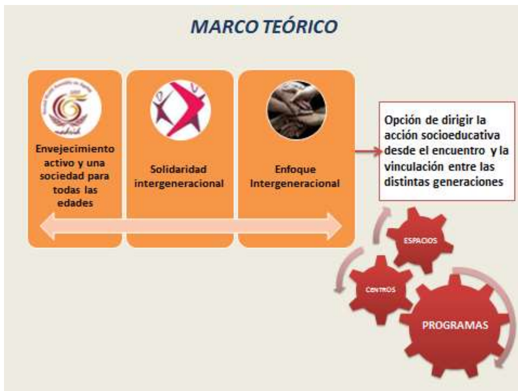
Imagen 1 – Marco Teórico (Elaboración propia)

En base a lo expuesto, entendemos por enfoque intergeneracional la opción de dirigir la atención y la capacidad de acción institucional hacia los problemas sociales desde el supuesto de que la respuesta está en el fortalecimiento de los procesos de desarrollo humano, respuesta que puede ser impulsada y desarrollada desde el encuentro y la vinculación entre generaciones. En torno a la Educación Social, se configura así un marco teórico que envuelve las acciones socioeducativas.